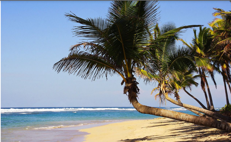
Plage de Punta Cana