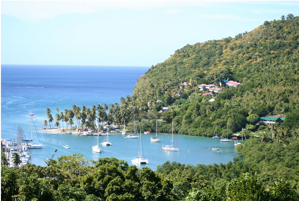
Sainte Lucie - Baie de Marigot

En effet, depuis de nombreuses années la société française est leader sur le marché des solutions de location de voitures dans les Antilles à des tarifs low-cost avec des services combinant fiabilité et efficacité et surtout répondant aux critères internationaux en la matière.