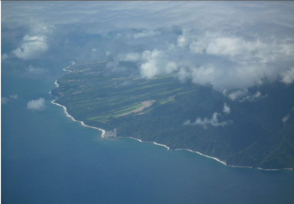
Marie galante vue d'avion